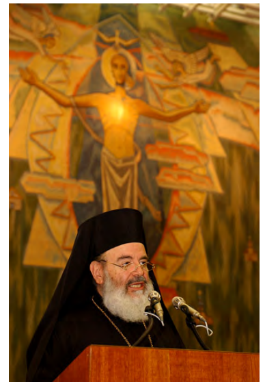
Ο αρχιεπ. Χριστόδουλος στο ΠΣΕ

- «Εξαρτάται. Είναι και μερικοί που ξεκινούν με καλή διάθεση. Αλλά, όταν μαζεύονται τί μάγοι, τί πυρολάτρες, τί Προτεστάντες, ένα σωρό -άκρη δεν βρίσκεις-, για να φέρουν την ειρήνη στον κόσμο, πώς να βοηθήσουν; Ο Θεός να με συγχωρέσει, αυτά είναι κουρελούδες του διαβόλου. Γίνεται ειρήνη με αμαρτωλό συνεταιρισμό; Πώς μπορεί να έρθει η ειρήνη, όταν οι άνθρωποι δεν συμφιλιωθούν με τον Θεό; Μόνον όταν συμφιλιωθεί ο άνθρωπος με τον Θεό, έρχεται και η εσωτερική ειρήνη και η