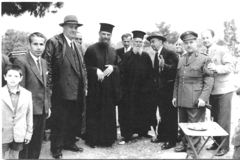
Με τον άγιο γέροντα Πορφύριο τον Καυσοκαλυβίτη.