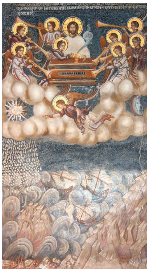
Οι Σάλπιγγες της Αποκάλυψης

ΤΟΥ ΑΓΙΟΥ ΕΥΑΓΓΕΛΙΣΤΟΥ ΙΩΑΝΝΟΥ ΤΟΥ ΘΕΟΛΟΓΟΥ