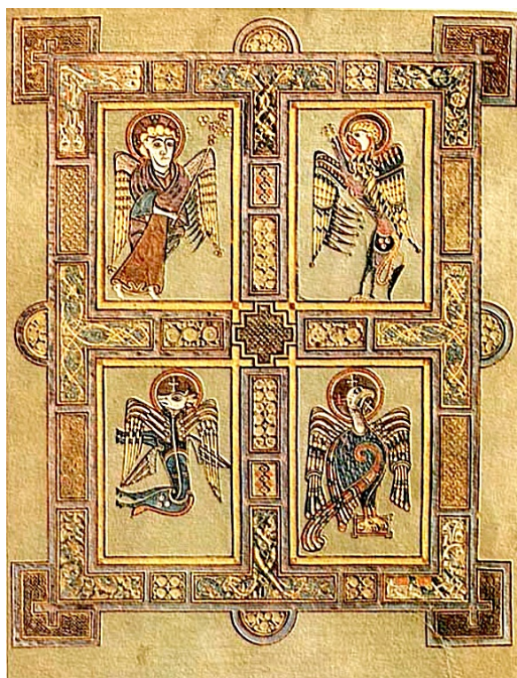
Τα τέσσερα (4) «ζώα»

ΤΟΥ ΑΓΙΟΥ ΕΥΑΓΓΕΛΙΣΤΟΥ ΙΩΑΝΝΟΥ ΤΟΥ ΘΕΟΛΟΓΟΥ