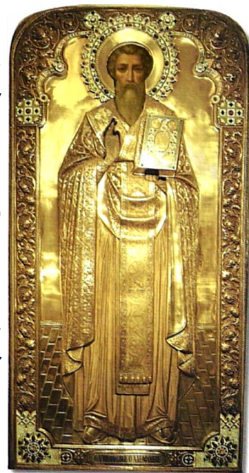
Άγιος Ιάκωβος ο αδελφόθεος

Σταυρού. Η υπόλοιπη Παλαιά Διαθήκη μαρτυρεί ότι η εντολή απομάκρυνσης από τον Παράδεισο των πρωτοπλάστων ήταν αδύνατο να ανακληθεί λόγω της πληθώρας της αμαρτίας, για την οποία αντί σωτηρίας, οι τότε άνθρωποι καταστράφηκαν με κατακλυσμό, πλην των οκτώ μελών της οικογενείας του Νώε. Η ανθρωπότητα είχε φτάσει στη